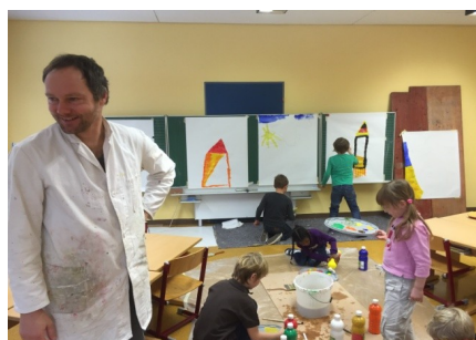
Malen mit Kindern